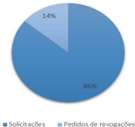
Figura 1: Levantamento de Dados das Medidas Protetivas Solicitadas e Revogadas pelo Setor de Violência Doméstica - DPE/AL

Solicitaram-se ao setor de Violência Doméstica da DPE/AL os números de requerimentos de solicitações e de revogação das medidas protetivas. No período de setembro de 2021 a junho de 2023, foram registradas 477 solicitações de medida protetiva e, destas, 69 pedidos de revogação. O gráfico a seguir exemplifica melhor esses dados.