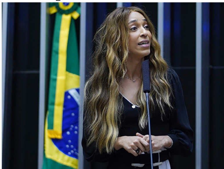
Figura 1. ERIKA SANTOS SILVA